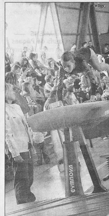
Le saut : acrobatique et toujours dangereux.

• Le championnat de Picardie de gymnastique se poursuit aujourd'hui à partir de 8 h 15 jusqu'à 17 heures au Cosoc de Corbie (dans l'enclos). Entrée gratuite. Restauration et buvette sur place.