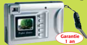
Appareil photo numérique