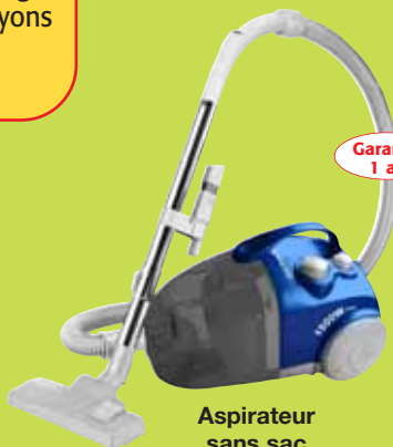
Aspirateur sans sac