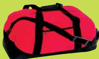
Sac de sport