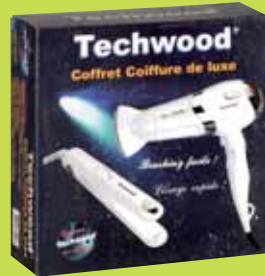
Coffret "Femme" (Sèche-cheveux et Lisseur)