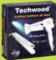
Coffret "Femme" (Sèche-cheveux et Lisseur)