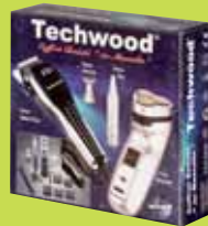
Coffret "Homme" (Rasoir, Tondeuse, etc...)