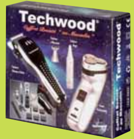
Coffret "Homme" (Rasoir, Tondeuse, etc...)