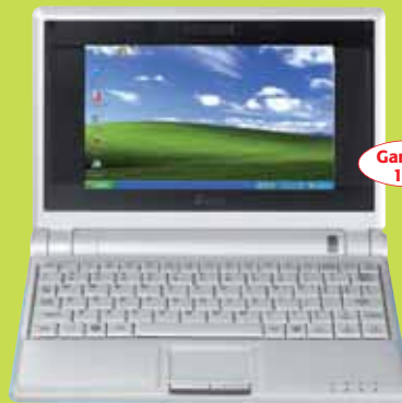
Ordinateur portable écran 7"