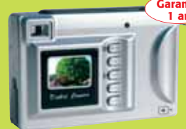
Appareil photo numérique