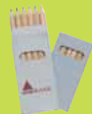
Boîte de crayons