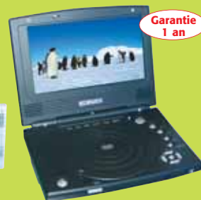
Lecteur DVD portable