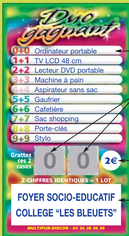
TV LCD 48 cm