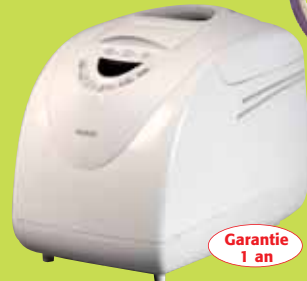
Machine à pain